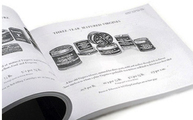
Catálogo da Dunhill, de 1928.

Preparar uma boa mistura de tabacos vai muito além do que apenas selecionar, dosar e mesclar componentes. Só isto realmente não basta. A produção de uma mistura sofisticada como as que Alfred Dunhill desejava produzir exigia operações como envelhecer componentes ou a mistura como um todo, estufar, tostar, cozinhar a vapor, prensar a frio ou a quente e etc., coisas que simplesmente não havia como realizar às pressas no balcão, à vista do cliente. Assim, em 1912 Alfred Dunhill lançou suas três primeiras misturas mais sofisticadas, vendidas já embaladas, bem mais elaboradas que as suas iniciais “My Mixture” de balcão. Foram a “Royal Yacht”, a “Durbar” e a “Cuba” (O nome Cuba era uma alusão à presença marcante de folhas de charutos nos componentes da mistura que, de fato, vinham de Cuba, da fábrica La Corona).