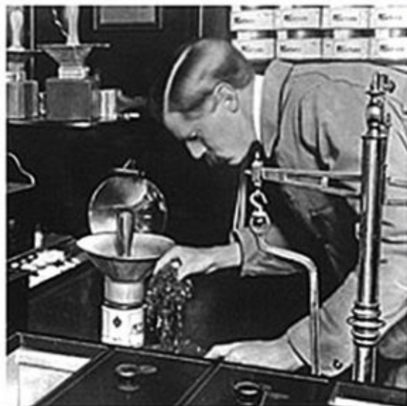
Alfred Dunhill exercendo sua arte.

Assim se iniciou a vertiginosa carreira do talvez mais famoso blender conhecido. Mas seus apreciadíssimos flakes, plugs, rolls em embalagens lacradas ainda estavam por vir. O estrondoso sucesso de Alfred Dunhill deveu-se à sua perspicácia, ao seu imenso bom gosto, à sua sensibilidade, a seu obsessivo perfeccionismo e, claro, a tabacos de muito boa qualidade que ele obtinha tanto de um importador escocês como de uma cooperativa londrina.