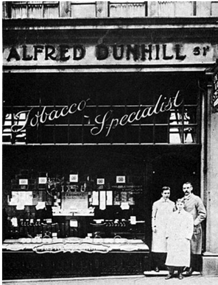
A fachada da primeira loja Dunhill, em Duke Street, ao redor do ano de 1920.

Como tantas outras tabacarias inglesas daquela época, a Alfred Dunhill Ltd. queria atrair compradores abastados que pudessem pagar por sofisticados serviços personalizados. Para isso, entre muitos outros produtos e artigos para fumantes, Alfred Dunhill criou as “My Mixture”.