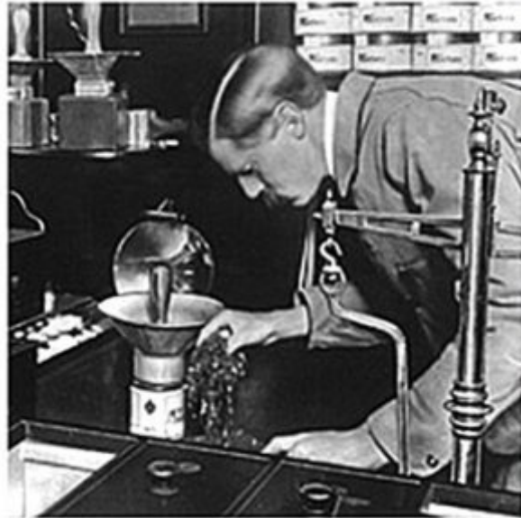
Alfred Dunhill exercendo sua arte.

Assim se iniciou a vertiginosa carreira do talvez mais famoso blender conhecido. Mas seus apreciadíssimos flakes, plugs, rolls em embalagens lacradas ainda estavam por vir. O estrondoso sucesso de Alfred Dunhill deveu-se à sua perspicácia, ao seu imenso bom gosto, à sua sensibilidade, a seu obsessivo perfeccionismo e, claro, a tabacos de muito boa qualidade que ele obtinha tanto de um importador escocês como de uma cooperativa londrina.