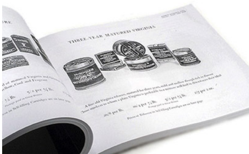
Catálogo da Dunhill, de 1928.

Preparar uma boa mistura de tabacos vai muito além do que apenas selecionar, dosar e mesclar componentes. Só isto realmente não basta. A produção de uma mistura sofisticada como as que Alfred Dunhill desejava produzir exigia operações como envelhecer componentes ou a mistura como um todo, estufar, tostar, cozinhar a vapor, prensar a frio ou a quente e etc., coisas que simplesmente não havia como realizar às pressas no balcão, à vista do cliente. Assim, em 1912 Alfred Dunhill lançou suas três primeiras misturas mais sofisticadas, vendidas já embaladas, bem mais elaboradas que as suas iniciais “My Mixture” de balcão. Foram a “Royal Yacht”, a “Durbar” e a “Cuba” (O nome Cuba era uma alusão à presença marcante de folhas de charutos nos componentes da mistura que, de fato, vinham de Cuba, da fábrica La Corona).